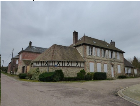
Les abords du monument