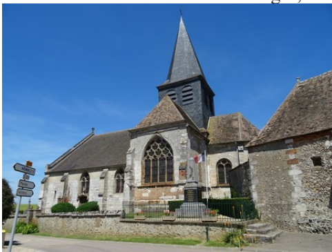
L'église de Guiseniers (inscrite MH)

Les avis seront cohérents avec ceux émis ces dernières années, à savoir : pas de maisons à volume compliqué (type V, W, Y, ou Z), pentes à 45° pour les volumes principaux, ardoise ou tuile plate de teinte brun vieilli, à 20u/m 2 , avec un débord de toiture de 20cm, enduit de teinte beige clair avec modénatures (au choix : chaînages, encadrement de fenêtres, soubassement, colombage...). *Voir les autres fiches.