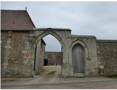
Le portail d'entrée et ses arcades brisées