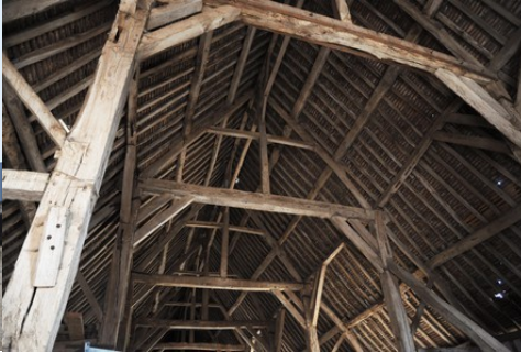
La charpente de la grange

Pour la zone en rose foncé dans le périmètre de 500m