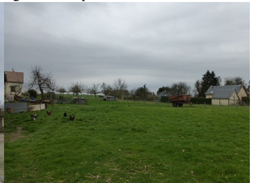
Champs au sein de la commune