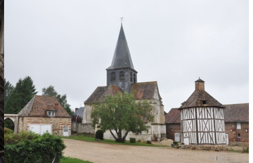
L'église et le colombier vus de la cour

Il est préférable d'éviter les constructions qui viendraient au-dessus de la ligne de paysage existante (maison à deux niveaux, bâtiments agricoles de type silo, château d'eau, éolienne...). Les projets éoliens ne doivent pas se trouver dans l'axe majeur du château à moins de nuire irrémédiablement à son caractère.