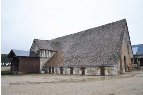
La grange dîmière

Pour la zone en rose foncé dans le périmètre de 500m