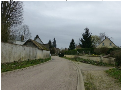
Rue de Guiseniers