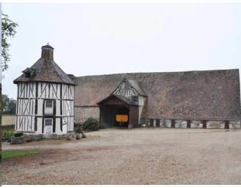
Le colombier et la grange