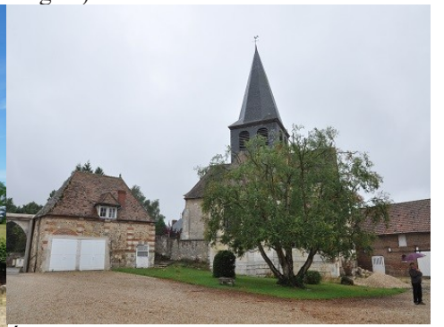
Église vue depuis la cour