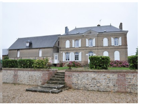
Le logis reconstruit au XIX e siècle