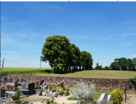
Les champs vus du cimetière